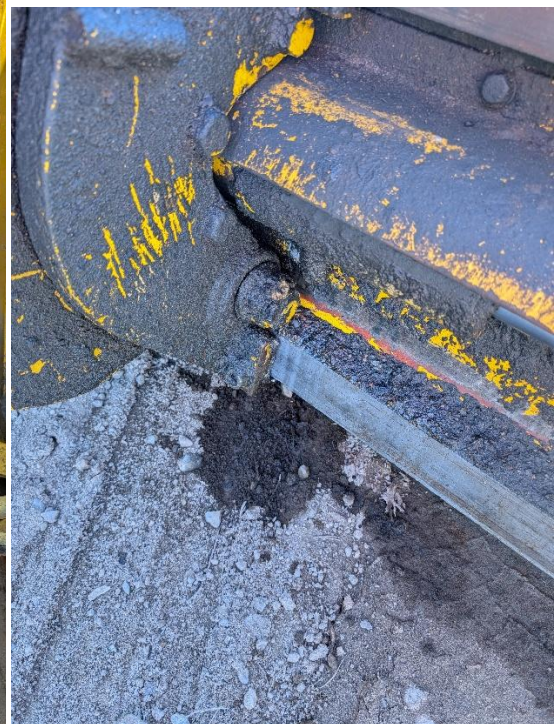
Karhu vähän vuotaa öljyä sieltä ja täältä.