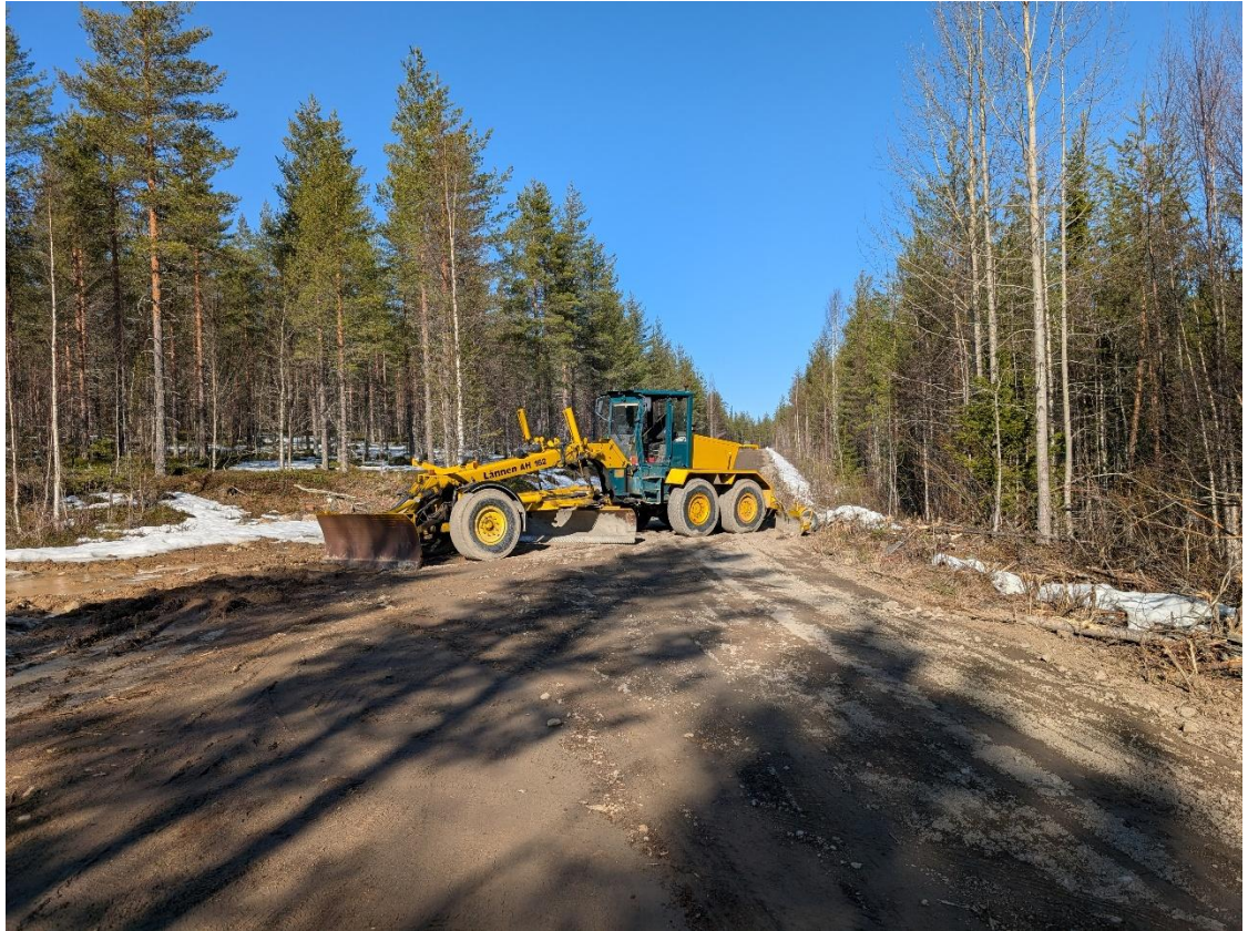
Karhulla tukittu Sortovaarantie (valtion maalla).