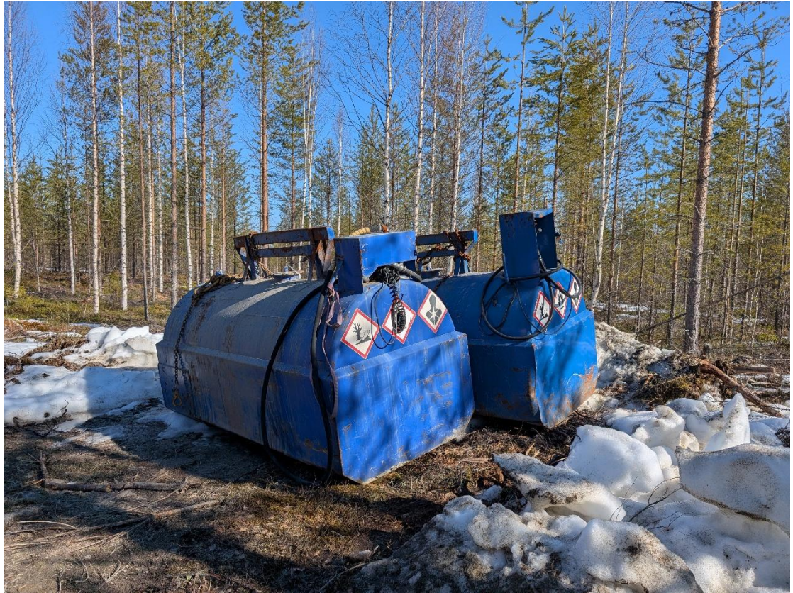
Palavan nesteen varastointia.